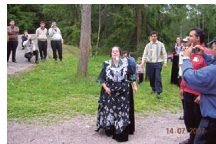
Leirillä pidettiin hauskaa mm. kilpailujen merkeissä. Katilla kananmuna pysyy hyvin lusikassa ja vauhti on kova. Hämmöittäkö jo voitto?

Ainut asia, joka jäi harmittamaan meitä kaikkia, oli se, että