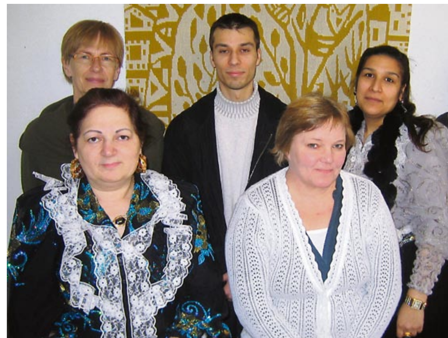
Roti 2 -hankkeen tukihenkilöt auttavat ja neuvovat nuoria opintoihin liittyvissä kysymyksissä, tapaavat vanhempia ja toimivat yhdessä koko perheen kanssa nuoren koulunkäynnin edistämiseksi.

Nuoria ja heidän vanhempiensa on hankkeessa mukana 63. Tukihenkilöinä työskentelee