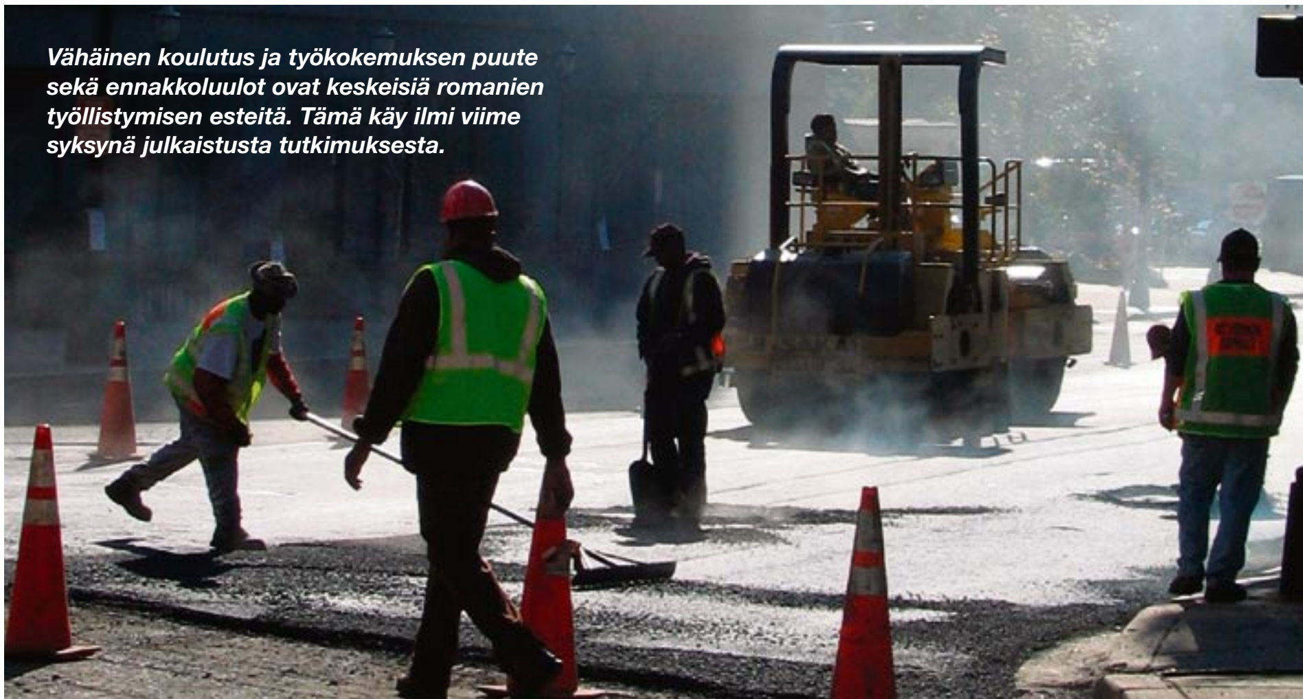
Vähäinen koulutus ja työkokemuksen puute sekä ennakkoluulot ovat keskeisiä romanien työllistymisen esteitä. Tämä käy ilmi viime syksynä julkaistusta tutkimuksesta.